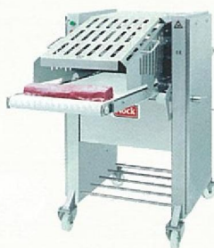
Anfrosten der Fleischwaren ist nicht erforderlich.

Die Rundmesser-Schneidemaschinen Typ Cortex CB 495 Slicer der Nock Maschinenbau GmbH aus Friesenheim sind seit 2001 in vielen Ländern erfolgreich im Einsatz, wenn große Mengen Fleisch oder andere, nicht gefrorene, knochenlose Produkte schonend und wirtschaftlich in Scheiben oder Streifen geschnitten werden müssen, wie zum Beispiel Schnitzel, Schweinebauch, Geflügelfleisch, oder Fischfilets. Die Schnitte erfolgen in senkrechter Richtung, gleichzeitig und sehr schonend, ohne Quetschen oder Pressen des Produktes. Anfrosten der Produkte ist erlaubt, aber für gute Schneideergebnisse nicht erforderlich. Die