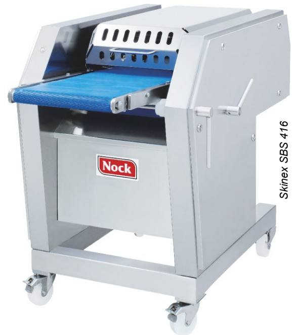
Skinex SBS 416