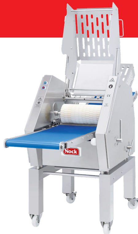
Vista delantera con cubierta abierta