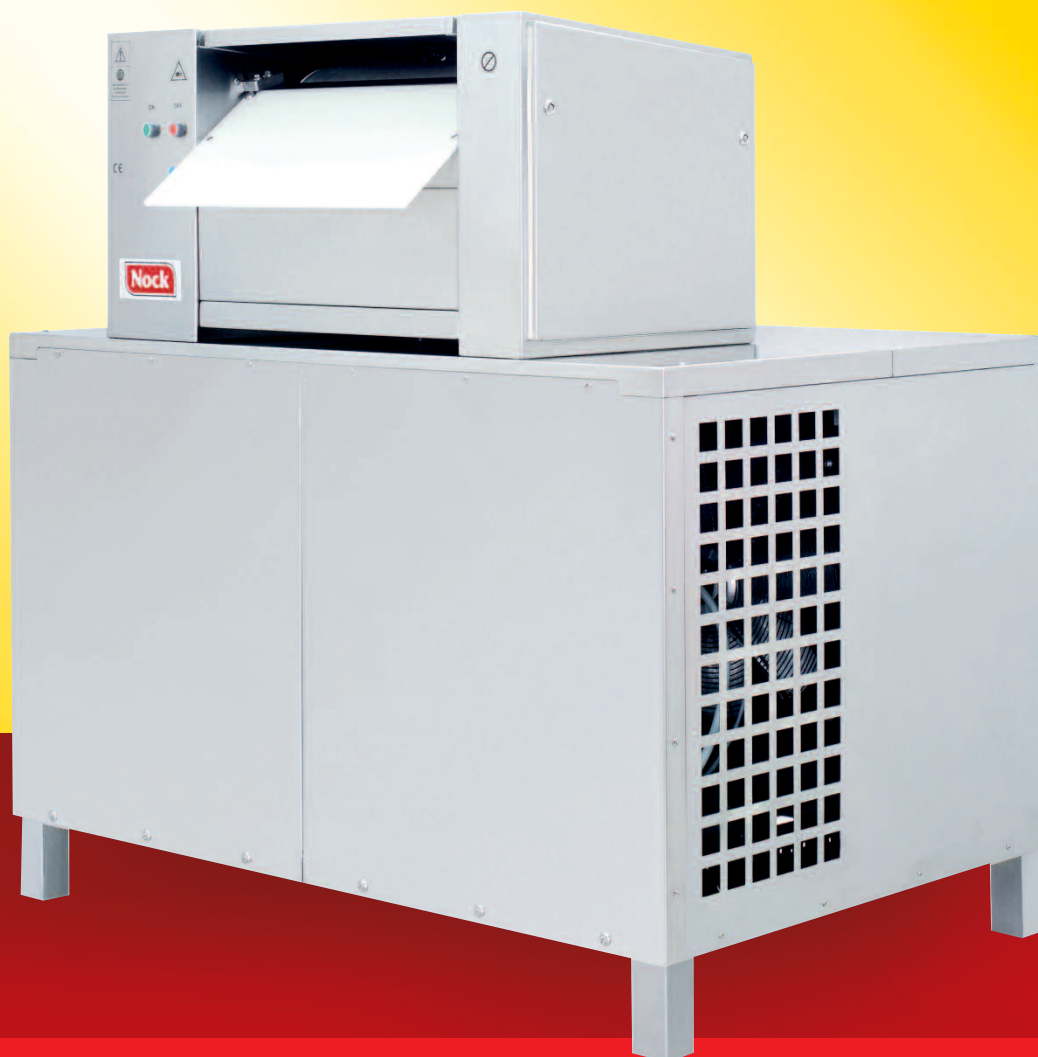
NOCK NRE 2500